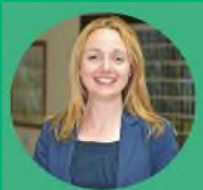
Cyng Llinos Medi Aelod Arweiniol