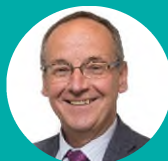
Cyng Dyfrig Siencyn Aelod Arweiniol